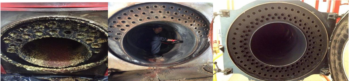
LOŽIŠTE POSLIJE ČIŠĆENJA