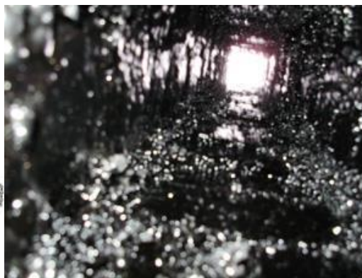
ROTAMAT komplet sa lancem za čišćenje smole i naslage čađe u dimnjaku