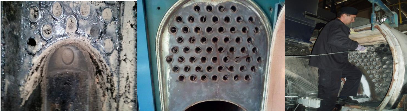
LOŽIŠTE PRIJE ČIŠĆENJA

-Izvanredni pregled ložišta i dimnjaka provodi se prije svake promjene goriva, nakon svakog izvanrednog događaja koji može utjecati na tehnička svojstva ložišta i dimnjaka ili izaziva sumnju u uporabljivost dimnjaka, te po inspekcijskom nadzoru.